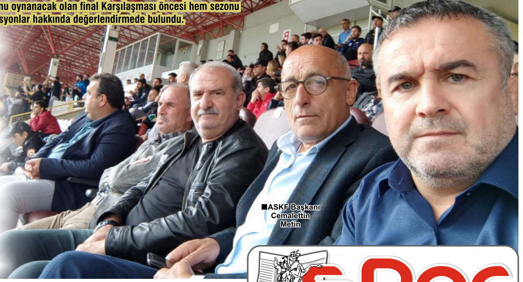
■ ASKF Başkanı Cemalettin Metin