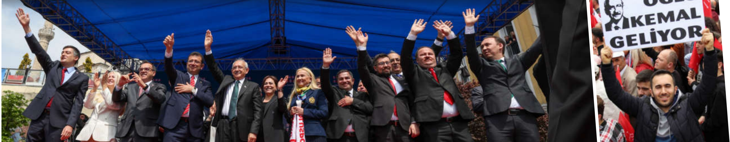
■ Cumhurbaşkanı Adayı Kemal Kılıçdaroğlu