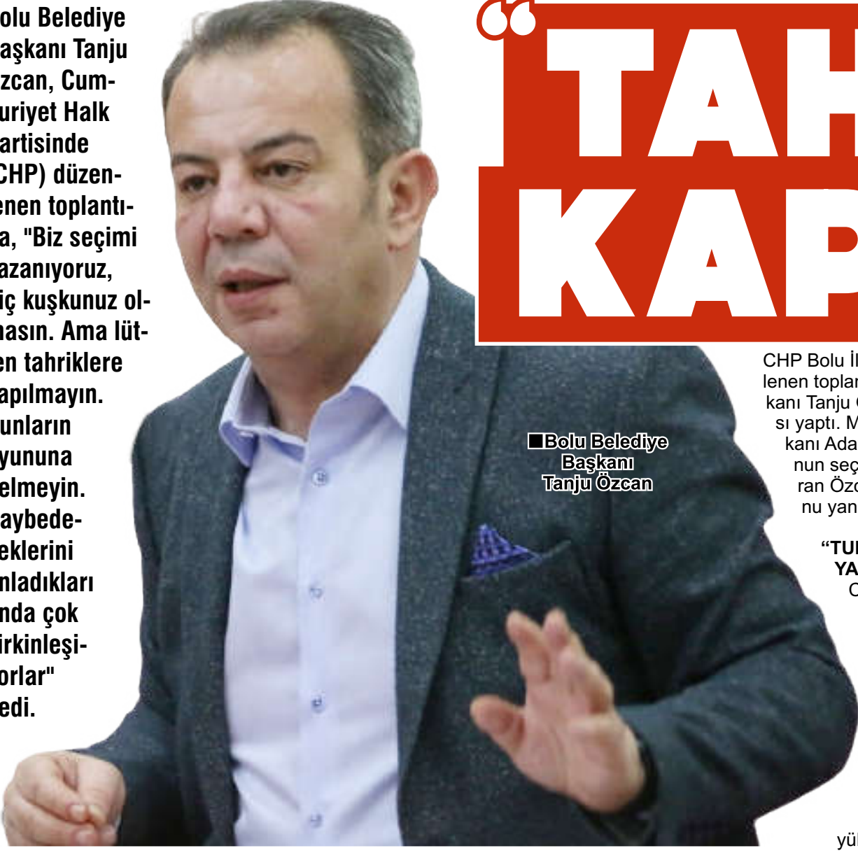
■ Bolu Belediye Başkanı Tanju Özcan

Bolu Belediye Başkanı Tanju Özcan, Cumhuriyet Halk Partisinde (CHP) düzenlenen toplantıda, "Biz seçimi kazanıyoruz, hiç kuşkunuz olmasın. Ama lütfen tahriklere kapılmayın. Bunların oyununa gelmeyin. Kaybedeceklerini anladıkları anda çok çirkinleşiyorlar" dedi.