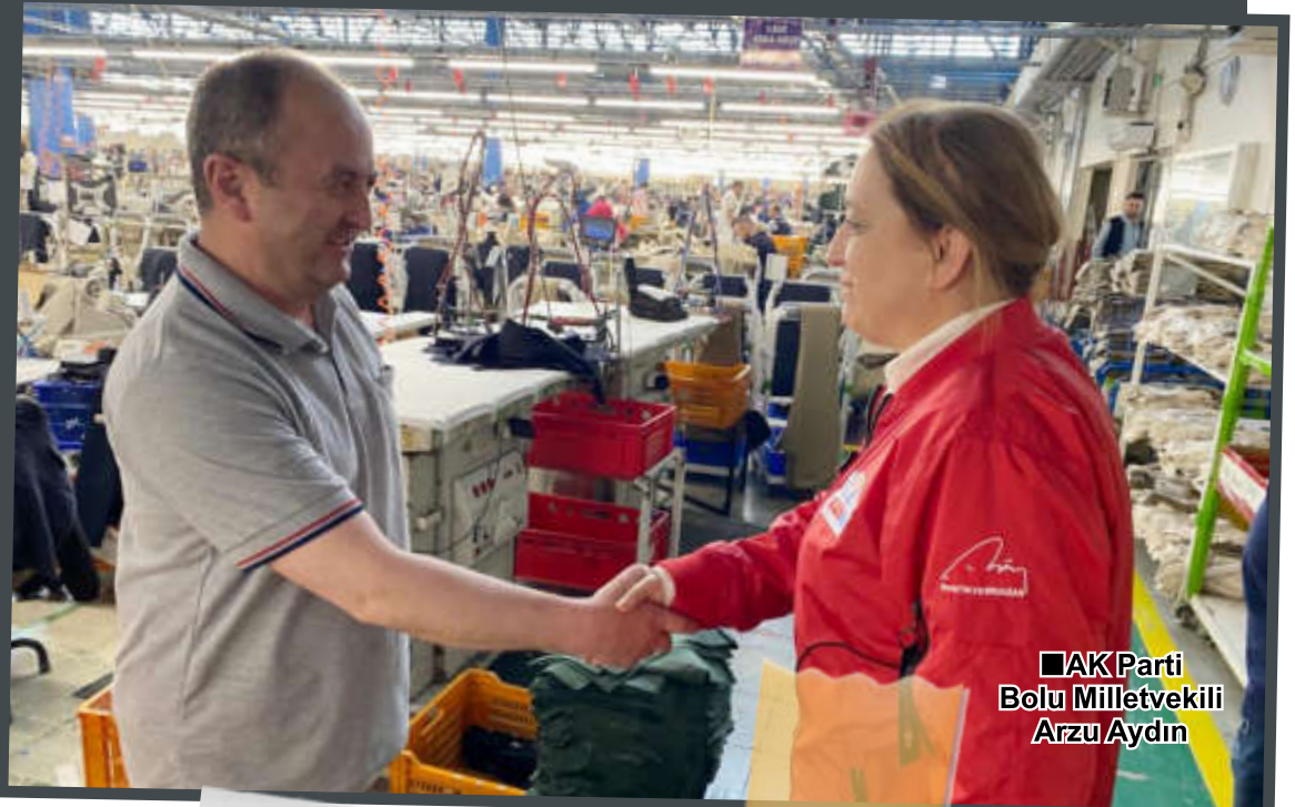
■ AK Parti Bolu Milletvekili Arzu Aydın