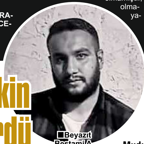
■ Beyazıt Bestami A.