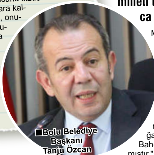
■ Bolu Belediye Başkanı Tanju Özcan