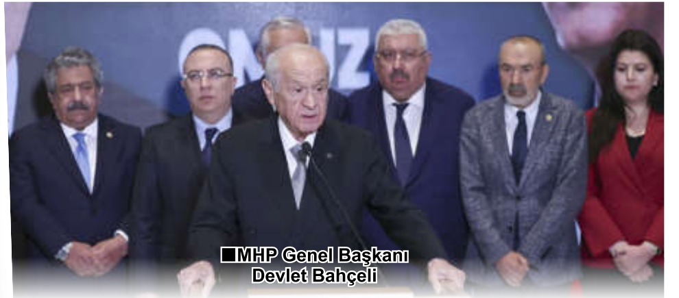
■ MHP Genel Başkanı Devlet Bahçeli