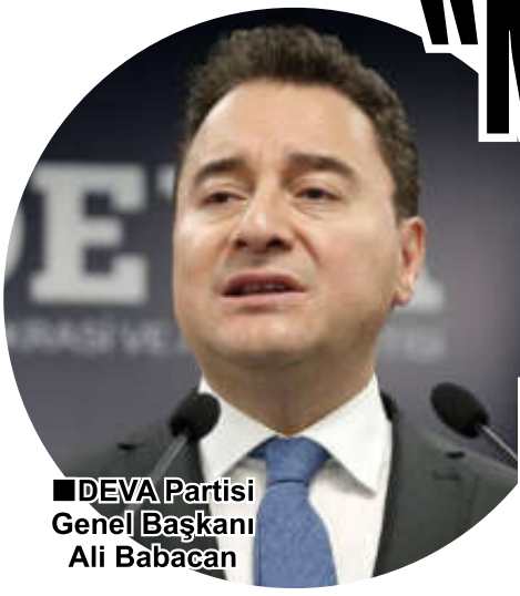
■ DEVA Partisi Genel Başkanı Ali Babacan