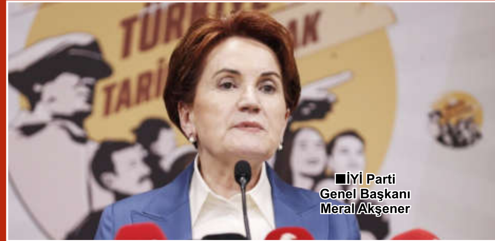
İYİ Parti Genel Başkanı Meral Akşener

Seçim sonucunun hayırlı olmasını dileyerek, Cumhurbaşkanı Erdoğan'ı tebrik eden Akşener, “Kesin olmayan sonuçlara göre yeniden cumhurbaşkanı seçilen Sayın Recep Tayyip Erdoğan'ı tebrik ediyorum. Seçim sonuçlarından çıkarması gereken dersler olduğunu da hatırlatmak isterim. Umarım Sayın Erdoğan'ın kazanma hırsı yeniden gözünü kör etmez. İftiralar, hakaretler havalarda uçmaz. Umarım ki kendisine oy vermiş, vermemiş bu ülkede yaşayan her bir vatandaşın Cumhurbaşkanı olduğunu bu defa kabul eder ve ona göre davranır. Umarım ki seçim sonuçlarının heyecanı, uzun zamandır kutuplaştırılmış ülkemizi yeniden makulde buluşturma fırsatını tepmez. Umarım ki tıpkı bizim gibi, kendisi de seçim sonuçlarının muhasebesini dürüst ve objektif bir biçimde yapar.” şeklinde konuştu. ■ HABER MERKEZİ