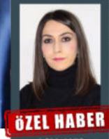
ÖZEL HABER ASLI AKIŞ