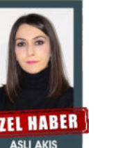
ÖZEL HABER ASLI AKIŞ