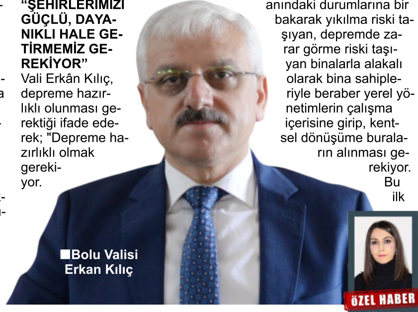
■ Bolu Valisi Erkan Kılıç

Bolu'da riskli bulunan okulların güçlendirmelerinin yapıldığını da hatırlayan Vali Kılıç; "Kamu kurumlarının binalarının güçlendirilmesi noktasında Milli Eğitim, Sağlık Müdürlüğü ve diğer bizi ilgilendiren kurumlarımız elinden gelen gayretini gösteriyor. Burada da yaklaşık ellinin üzerinde okulumuzu biz güçlendirdik. Depreme hazır hale getirdik. Bu noktada da çok fazla bir sıkıntımız kalmadığını düşünüyorum. Sağlıkla ilgili de aynı şekilde sağlık tesislerimizin de güçlendirme noktasında çalışmalarımız devam ediyor. Bir tane riskli gördüğümüz fizik tedavi hastanemizi boşalmıştı." açıklamasında bulundu.