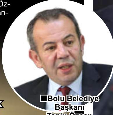
■ Bolu Belediye Başkanı Tanju Özcan