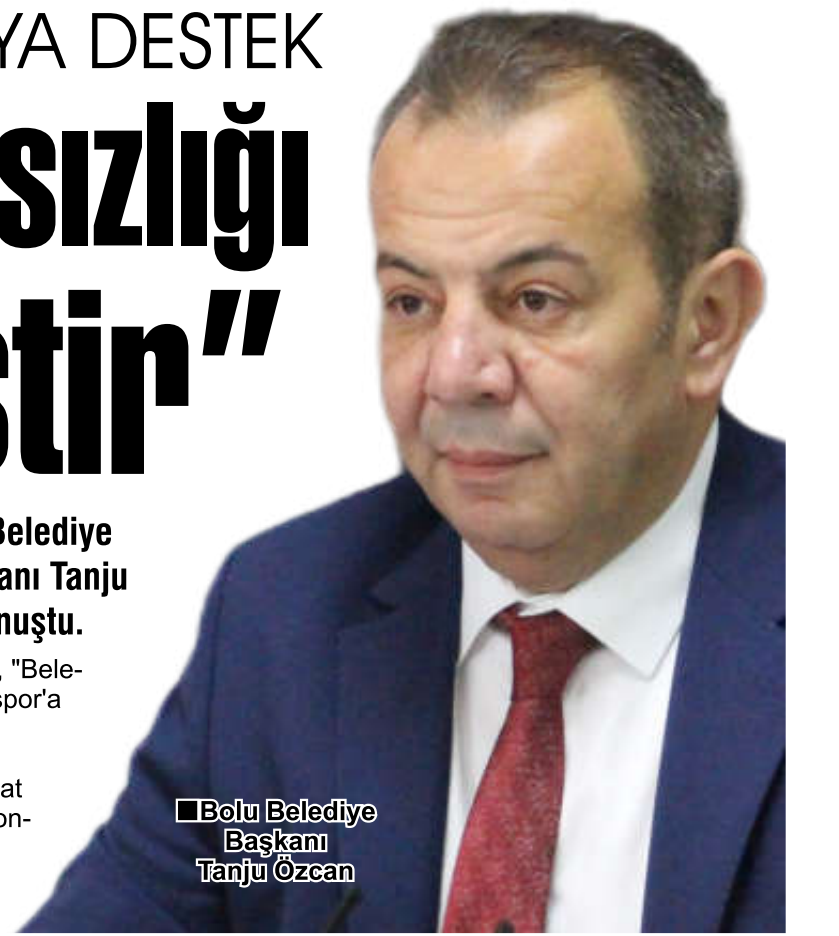
■ Bolu Belediye Başkanı Tanju Özcan

AK Parti Bolu İl Başkanı Suat Güner, yaşanan gerginlik sonrasında yazılı bir açıklama yaparak başkan Özcan'a yükledi.