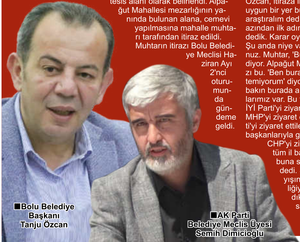
■ Bolu Belediye Başkanı Tanju Özcan