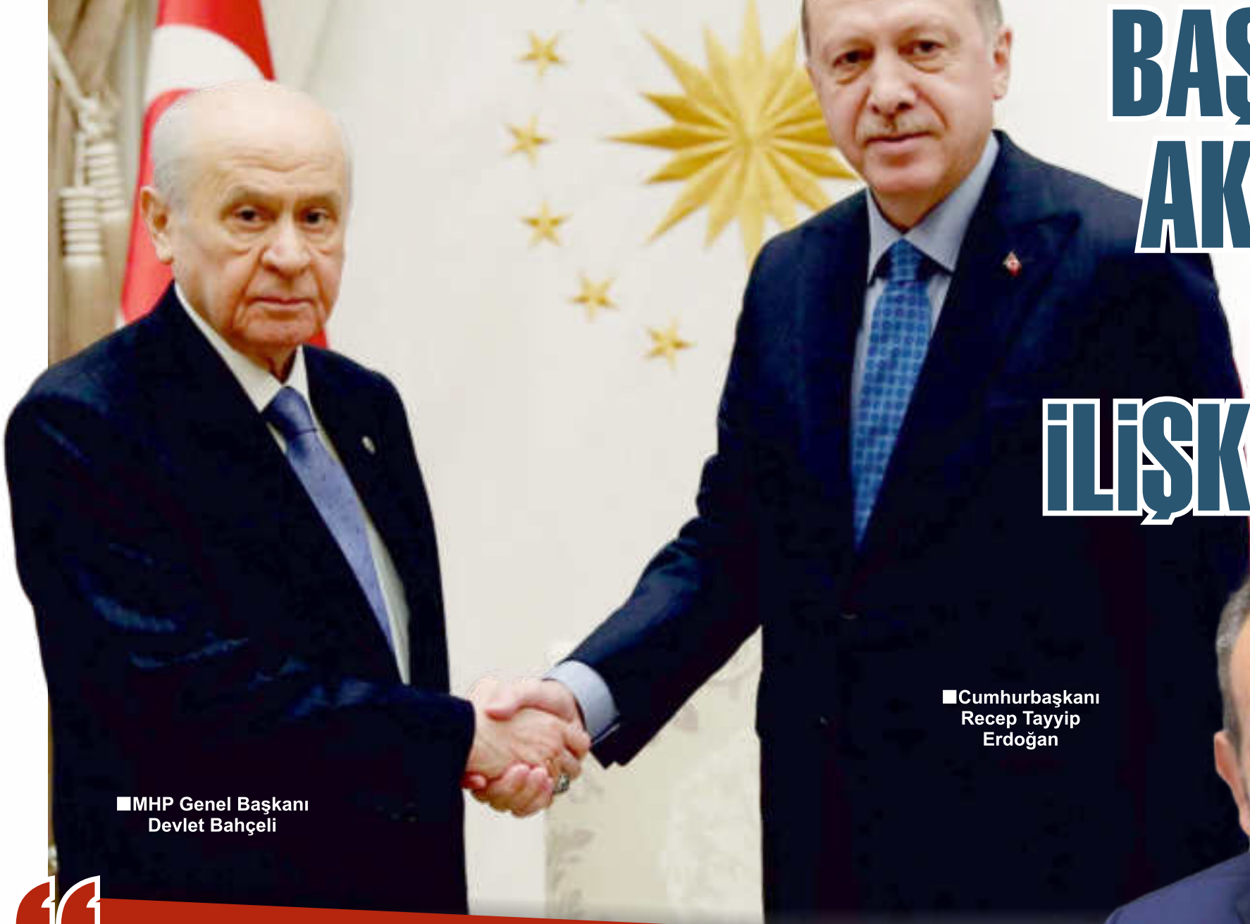
■MHP Genel Başkanı Devlet Bahçeli