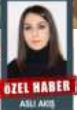
ÖZEL HABER ASLI AKIS

Kampanya kapsamında Bolu merkezinde yaklaşık 900 adet Ramazan kolisi, 250 adet alışveriş çeki ile birlikte ihtiyaç sahiplerine 68.000 TL fitre ve zekat parası dağıtıldı. Ayrıca her gün Ülkü Ocakları İl Binası ve MHP İl Başkanlığı'nda en az 100 kişilik iftar ve sahur programları düzenlenerek toplamda 450.000 TL'lik maliyet karşılandı.